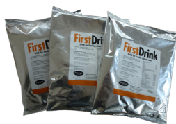
Carton de 12 sachets

Application: 1 kg par animal et par jour, dès 4 semaines avant le vêlage. Remplace la distribution de minéraux