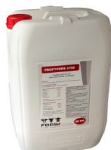
Fût de 20 kg

Application: Comme aide au démarrage après le vêlage, en cas de manque de tonus, d'inappétence et de baisse de performances: 400 – 800 g par jour, une semaine avant et jusqu'à cinq semaines après le vêlage